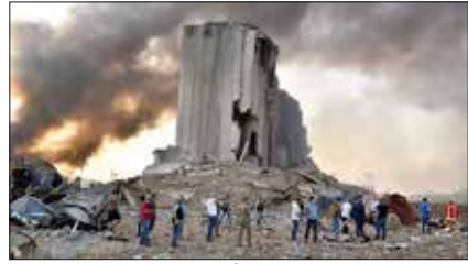
بقايا مرفأ بيروت

وأكدت قيادة العمليات المشتركة، في وقت سابق، أن الوضع آمن في العاصمة ولا يوجد أي تهديد، مضيفة أنها مستمرة في ملاحقة مطلق الصواريخ الذين يهددون أمن المنطقة. وكشف مصدر قضائي أن القضاء العراقي أصدر 4 مذكرات توقيف لشخصيات عسكرية ومدنية لها علاقة بالجموعات التي تنطلق الصواريخ على المبنى الدبلوماسي والعسكرية في بغداد والمحافظات الأخرى. وذكر مصدر أمني «أن الشخصيات المتورطة هم 3 قادة من كتائب حزب الله وشخصية مدنية»، على علاقة بالدعوة أبو علي العسكري.