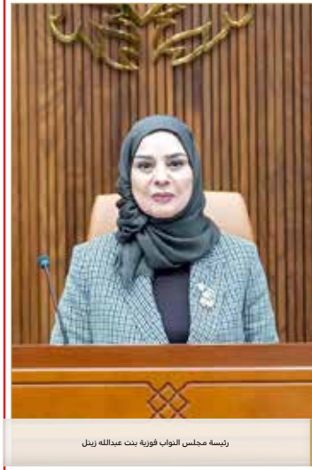
رئيسة مجلس النواب فورية بنت عبدالله رنيل

البلاد أكد النائب محمد الميسى أن تحسين كادر موظفي الوزارات والهيئات الحكومية ومعالجة أوضاع الموظفين الحاليين يهدف إلى تطوير مستوى جودة كفاءة الكادر الشري.