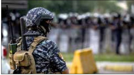
عنصر أمن عراقي في بغداد

بين التهويل العسكري عبر إطلاق مناورات بحرية في هرمز، ودعوات التهينة في العراق، أكد الرئيس الإيراني حسن روحاني، الثلاثاء، دعم بلاده لضبط السلاح المتفجرت والجماعات الخارجة عن القانون. ففي رسالة حملها وزير الطاقة الإيراني رضا اردانان إلى رئيس مجلس الوزراء العراقي مصطفى الكاظمي، أكد دعم طهران لخطوات الأمانة التي اتخذها في مواجهة السلاح المنفجرت، وضبط الجماعات الخارجة عن القانون، وبسط الأمن والاستقرار في عموم البلاد بقوة القانون.