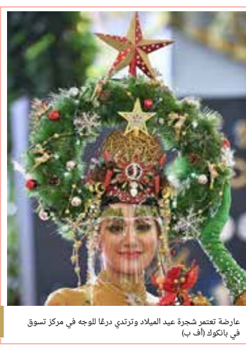
عارضة تعتمر شجرة عيد الميلاد وترتدي درعاً للوجه في مركز تسوق في بانكوك

أعلنت أكاديمية الفنون الفرنسية، الثلاثاء، وفاة مصمم الأزياء الشهير، بيير كارديان، عن عمر ناهز 98 عاماً، في منطقة نوبي، غربي العاصمة باريس. وأسس كارديان دار الأزياء الأولى سنة 1950، ولم يفارقه شغف "الموضة" منذ ذلك الحين، إلى أن حصد شهرة واسعة وفتحت فروع الدار في مختلف مناطق العالم. وبحسب ويعد الراحل رجلاً عصامياً، بحسب