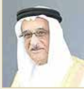
الشيخ محمد بن عبدالله

وأهاب الشيخ محمد بن عبدالله آل خليفة بكل فرد من أفراد المجتمع، التحلي بالمسؤولية المجتمعية تجاه وطنه وأهله عبر الحث على تعزيز الالتزام بكافة الإجراءات الاحترازية وبخذر. وأضاف: إن الجهود الكبيرة التي بذلها فريق البحرين لا سيما الكوادر الطبية