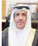
المستشار عدالله البوعيينين.

صدر عن المستشار عدالله بن حسن البوعيينين رئيس محكمة التمييز - نائب رئيس المجلس الأعلى للقضاء قرارا بخصوص المحكمة الصغرى الجنائية الثانية والثامنة والنظر في قضايا الإجراءات والتدابير المتعلقة بالحد من انتشار فيروس كورونا المعينة بالمخالفات والتجمعات التي تفتقر إلى الصفة المنصوص بها، حيث تنوّل المحكمة النظر في القضايا وصحت خلالها ٢٤ ساعة وتعمل طوال أيام الأسبوع وخلال اجازتي نهاية الأسبوع ورأس السنة الميلادية.