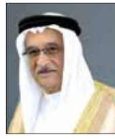
طبيب الشيخ محمد بن عبدالله

المسؤولية متجددة في الحفاظ على ما تحقق والنجاح على طريق مواجهة الجائحة دون تراخ أو كلل بما يسهم في حث الخطة لتحقيق الهدف المنشود وهو القضاء على هذه الجائحة كليا في مملكة البحرين في أقرب وقت بإذن الله تعالى». ونوه بأهمية تقليل الإختلاط للمساهمة بفعالية في التصدي للفيروس وخفض معدلات انتشاره وتجنب زيادتها، وذلك من خلال الحد من التواصل المجتمعي خارج الأسرة الواحدة في المنزل والحديث الاجتماعي وذلك في الشاطئ المعاد والمحدود، مؤكداً أن الظروف الحالية تحتم الحد من التواصل العائلي والاجتماعي قدر الإمكان