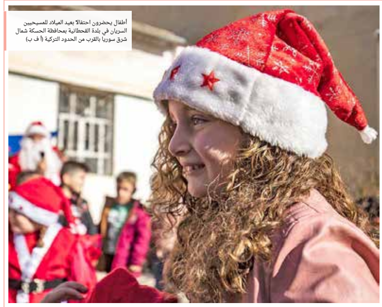
أطفال يحضرون احتفالاً بعيد الميلاد للمسيحيين السريان في بلدة القحطانية بمحافظة الحسكة شمال شرق سوريا بالقرب من الحدود التركية

إدارة التحرير: 973 17111444 / 973 1711467 / 385 @albiladpress.com / 2008 - تلست سنة قسم الإعلانات: 973 1711501 / 508 / 973 32224492 / 39615645 / 973 17580939 / 973 1711432 / 973 1711434 / 973 67133 / 973 1711434