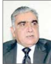
د. أكبر جعفري

مصفى الشاخوري: قال الخبير الاقتصادي الدكتور أكبر جعفري إن 60% من المخازن الشعبية «الخبازين» و«البرادات» بالمناطق الداخلية والقرى مؤجرة بالباطن، مشيراً إلى أن التأجير بالباطن يحدث إرباكاً في السوق التجارية، خصوصاً تلك المرتبطة برصد النمو الاقتصادي والتجاري، وإحصاءات الأوضاع السوق، مشيراً إلى أن الحكومة ليست ضد العمل وفتح المواطن البحرينى للسجلات لكنها تؤكد على أن يكون العمل ضمن الأطر القانونية المنظمة للقطاع التجاري بالمملكة، والتي تلطف حلها لتجار اولاً في السوق. وأضاف جعفري أن القطاعات الأكثر تأثراً من مشكلة التأجير بالباطن تكمن في قطاع الأطعمة «الكافيتريات - المخازن الشعبية - البرادات»، ذلك معال الإنشاءات، ونون يعدها مشكل السيارات ومحال الصياغة بشكل عام، وفقاً إلى أن المشكلة قديمة متجددة، إلا أن الوضع بات بحاجة