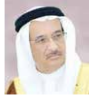
رئيس الأعلى للصحة

التحلي بالمسؤولية تجاه الوطن عبر الالتزام بالإجراءات الاحترازية