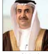
علي بن فaisal البوعيين

في التعامل مع فيروس كورونا وما يتخذ من إجراءات استباقية مستمرة للحد من انتشار الجائحة. وأضاف بأنه بالتنسيق مع جميع الجهات المختصة فقد تم تحديد آلية عمل مشتركة لتحقيق متطلبات هذه المبادرة التي تهدف إلى دعم الجهود الوطنية المبذولة لمواجهة الجائحة وتعزيز فاعلية الإجراءات المتخذة. فيما أكد النائب العام على أن جميع مراحل الدعوى الجنائية بما في ذلك المحاكمة لن تتجاوز يوماً واحداً، وذلك وفقاً لمتطلبات القضاء.