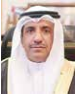
رئيس محكمة التمييز

صدر عن رئيس محكمة التمييز - نائب رئيس المجلس الأعلى للقضاء عبدالله الهميد، قرار بتخصيص المحكمتين الجنائيتين الثانية والثامنة للنظر في قضايا الإجراءات والتدابير المتعلقة بالحد من انتشار فيروس كورونا المعنفة بالجائحات والتجمعات التي تتجاوز الحدود المسموح به، حيث تتولى المحكمة النظر في القضايا وحسمها خلال 24 ساعة وتعمل طيلة أيام الأسبوع وخلال إجرائها نهاية الأسبوع ورأس السنة الميلادية.